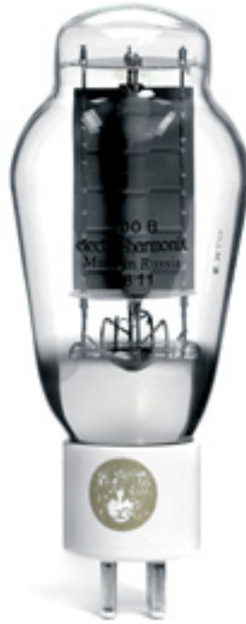
Gilt als hochanständig fürs Geld und als standfest: 300B von Electro-Harmonix

Compact und äußerst solide ausgeführt ist auch die Anzahl der hinteren Quellenanschlüsse. Drei Hochpegel-Eingänge – CD, Tape und Aux – stehen zur Verfügung, was im Normalfall für sinn- und standesgemäß ausgesuchte Quellgeräte auch völlig ausreichend ist. Undenkbar, dieses anmutige Röhrenschiffchen ernsthaft mit einer Armada unangemessener Signalzulieferer verbandeln zu wollen und zu verstärkenden Frondiensten für Satellitenreceiver, Flachbildfernseher oder sonstigen plebiszitären Aufgaben zu dingen! Insgesamt besitzt der Mastersound sogar vier Eingänge, denn da gibt es noch einen mit „Direct“ gekennzeichneten Anschluss. Über ihn wird die komplette Vorverstärkersektion samt Lautstärkeregelung umgangen, der 300B Compact läuft dann als reine Endstufe. Ein genauer Blick auf die Lautstärkeeinstellung des externen Vorverstärkers sei in diesem Fall dringend angeraten, sonst könnte es